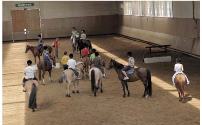
Stage 2009 au Haras des Jardies organisé par Dynamic Sèvres.

L'association Espaces propose une promenade fluviale commentée autour des Îles Seguin et Saint Germain, les 24 et 25 juillet. Rendez-vous pour l'embarquement et le débarquement au port de Sèvres, rue Troyon (durée environ 45 mn). Tarifs : Adulte 5 € / Enfants (-12 ans) 2,50 €. Inscription : fortement recommandée auprès de Geneviève Boyer au 01.55.64.13.40.