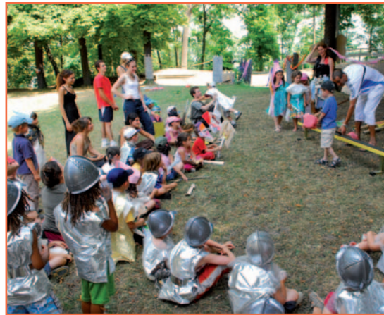
Chaque été, les accueils de loisirs organisent des activités à thème.

Dynamic Sèvres accueille tout l'été les amateurs de sports. Les stages multi-sports proposent des activités très variées : VTT, roller, natation, sports collectifs... Deux formules :