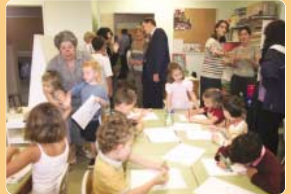
Le Maire a suivi la rentrée scolaire école Croix Bosset le 3 septembre.