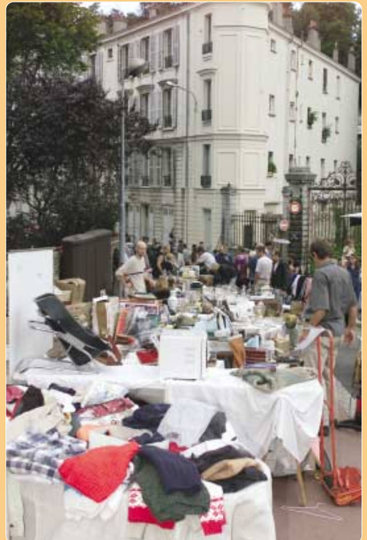
Et comme chaque année depuis 11 ans, la Brocante de Sèvres a connu une affluence record le 15 septembre.