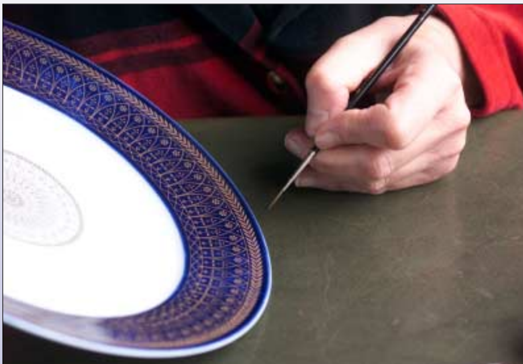
Les participants étaient invités à écrire sur le thème de la porcelaine.