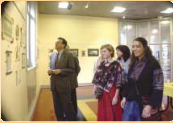
Inauguration de l'exposition "La Chine" à l'escale le 6 septembre.