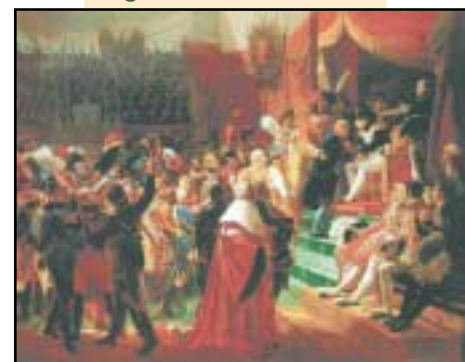
Exposition au SEL, du 7 au 11 novembre 2002.

En 1802, Bonaparte crée l'ordre de la Légion d'honneur pour récompenser les services militaires ou civils éminents rendus à la France. La Grande Chancellerie commémore cette année le bicentenaire de la création de l'Ordre, en organisant des manifestations aux Invalides, à l'Arc de Triomphe et à St Denis, complétées par l'émission d'un timbre-poste consacré à cet événement. La ville de Sèvres s'associe à cette commémoration en organisant une exposition avec la Société d'Entraide des Membres de la Légion d'Honneur. Celle-ci retrace l'histoire de cette distinction nationale à travers la diversité des hommes et des femmes ou encore des villes décorées, et parle du fonctionnement de la Grande Chancellerie et de la Société d'Entraide.