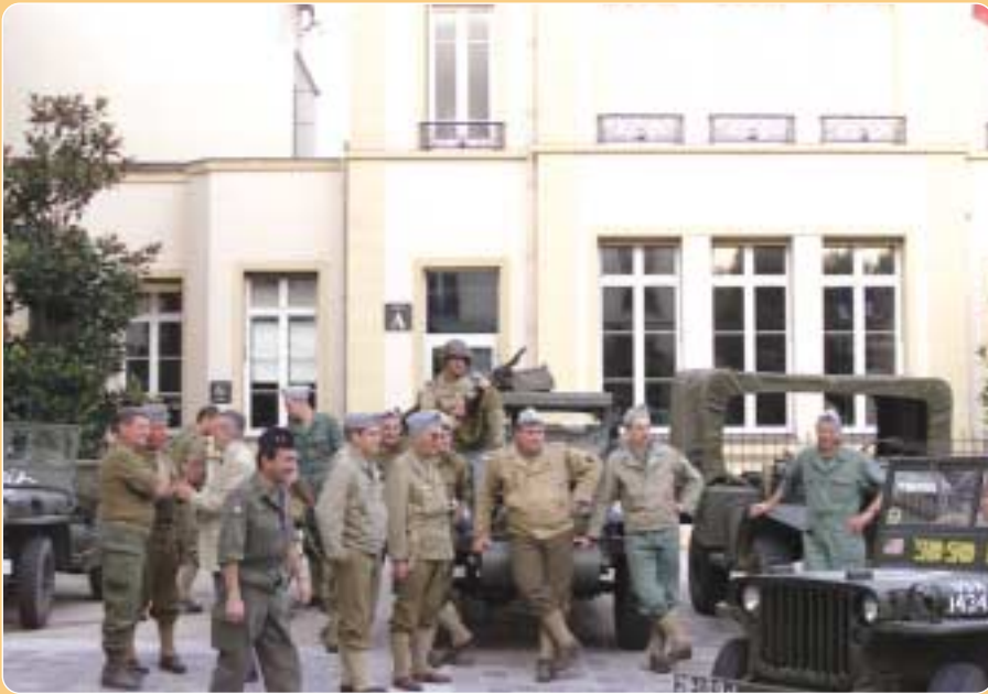
Commémoration de la Libération de Sèvres le 24 août.