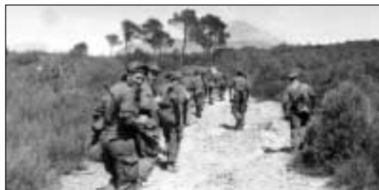
Pour Jacques Azadian et les Dragons : marche sous le soleil.

A voir du samedi 5 au dimanche 13 octobre, au SEL.