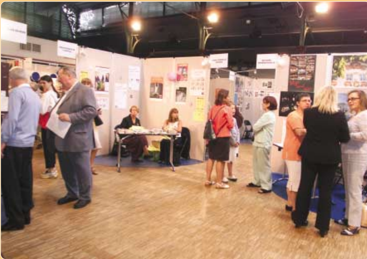
Le Forum des Associations en images les 7 et 8 septembre. Plus de 80 associations ont exposé pendant ces deux jours, au cours desquels de nombreuses animations furent proposées. Le 7 septembre, les associations se sont retrouvées pour dîner.