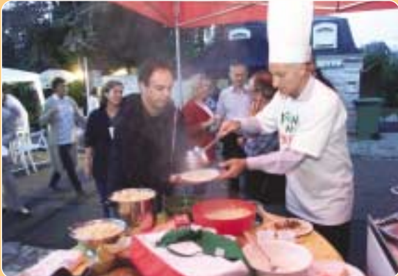
Dîner de quartier rue Georges Vogt le 7 septembre.