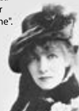
Figure emblématique du tournant des XIX e et XX e siècles, actrice tout autant qu'artiste, elle créa le "star système".

Dans le cadre des conférences Rencontres Université