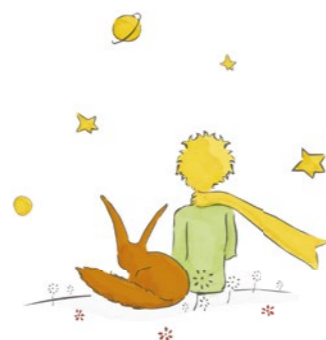
© Succession Antoine de Saint-Exupéry 2019