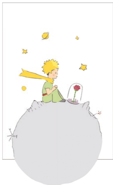
Le Petit Prince® © Succession Antoine de Saint-Exupéry 2019