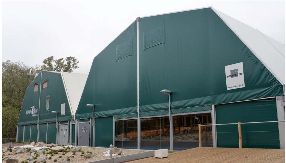
Deux nouveaux courts en Green Set remplacent ceux en béton poreux.