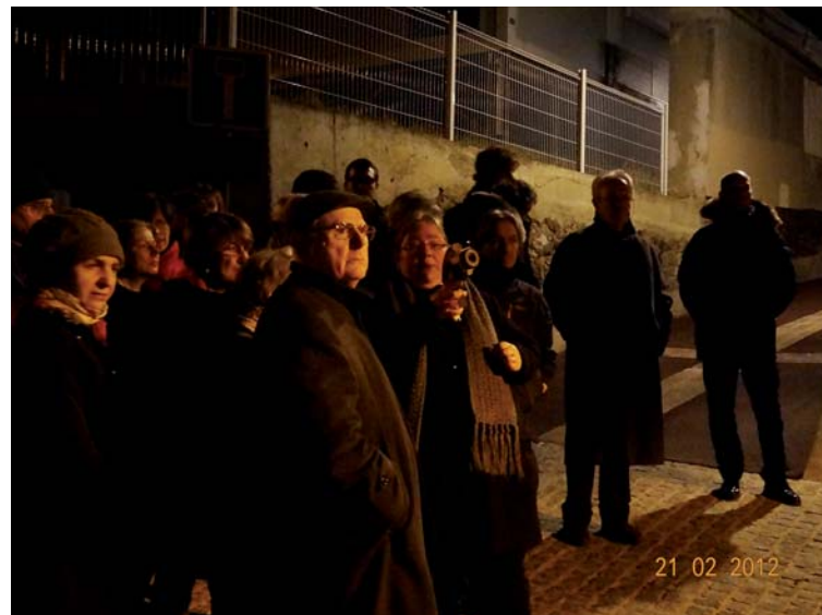
En février 2012, la Nuit de la thermographie se tenait à Sèvres.

Analyse des images. Le parcours sera suivi d'un échange convivial au cours duquel le conseiller info énergie analysera les images thermographiques prises lors de la soirée et répondra à toutes vos questions concernant l'isolation des bâtiments et les aides finan-