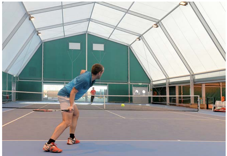
Pour les 658 adhérents, le plaisir de frapper dans la balle...

Financement : ville (participation du club : 37 000 €).