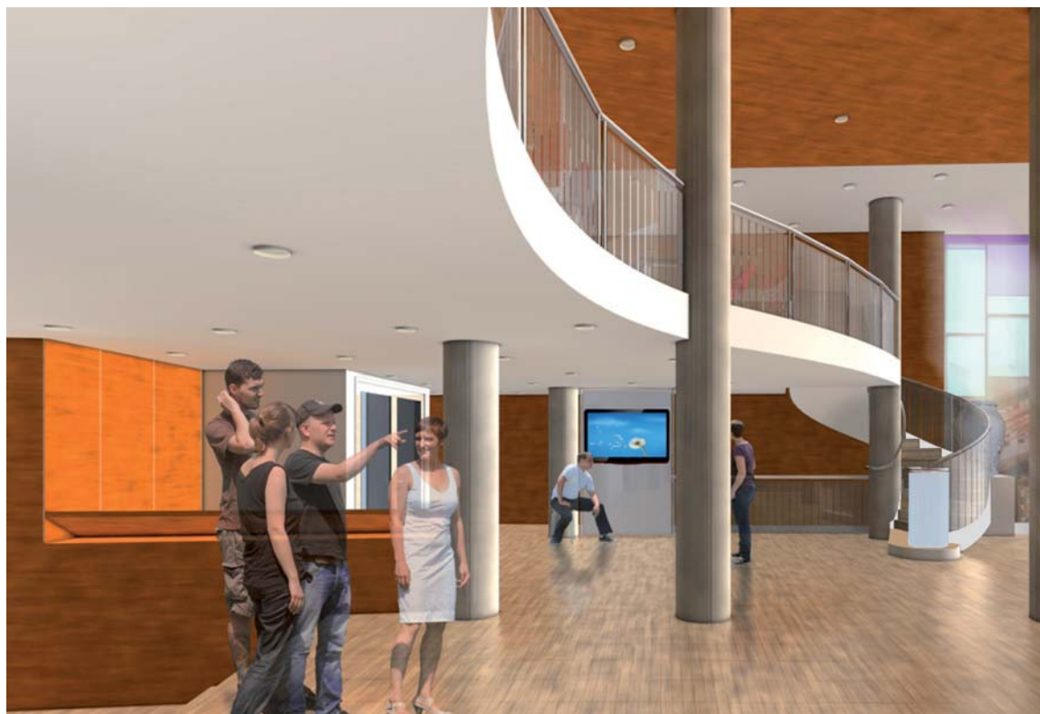
Le projet de réaménagement du hall de la Médiathèque.

Les subventions de l'État, de la région Île-de-France, du conseil général et de plusieurs parlementaires ramènent le coût des travaux pour la ville à environ 500 000 €.